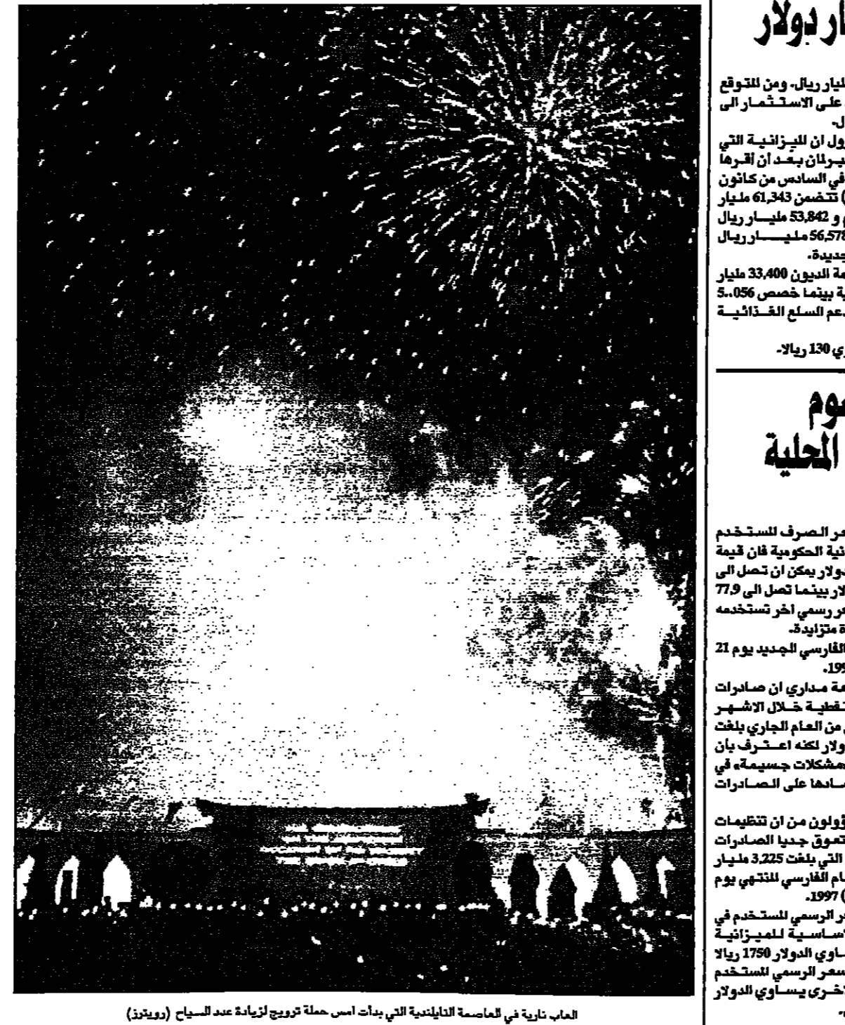
العاب خارية في الجامعة التايوانية التي بدأت اسما حلة ترويج لزيادة عدد السياح (رويترز)